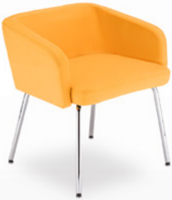
Hello LB 40