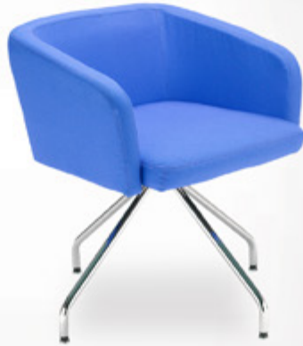
Hello LB 38