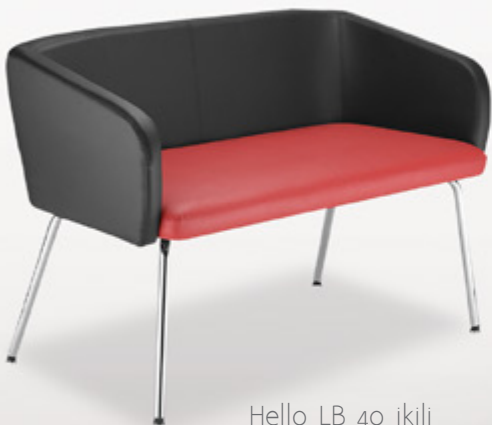
Hello LB 40 ikili