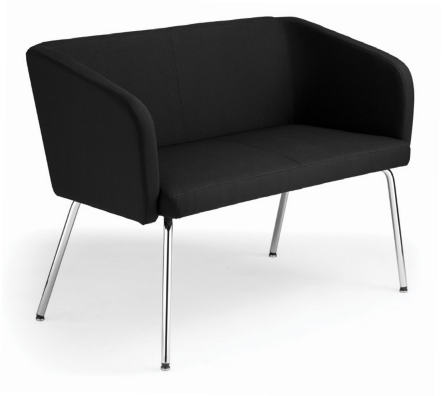
Hello HB 40 İkili