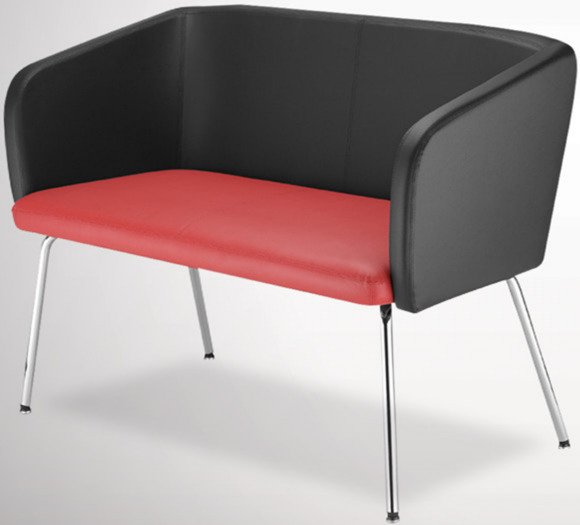
Hello HB 40 ikili