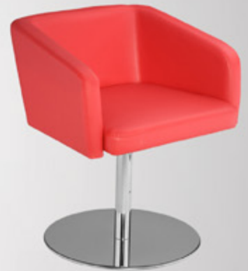
Hello LB 35