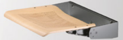
Henry 10 (Opsiyonel perforeli oturak)