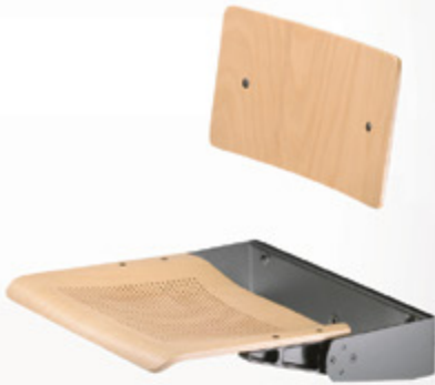
Henry 10 R (Opsiyonel perforeli oturak)