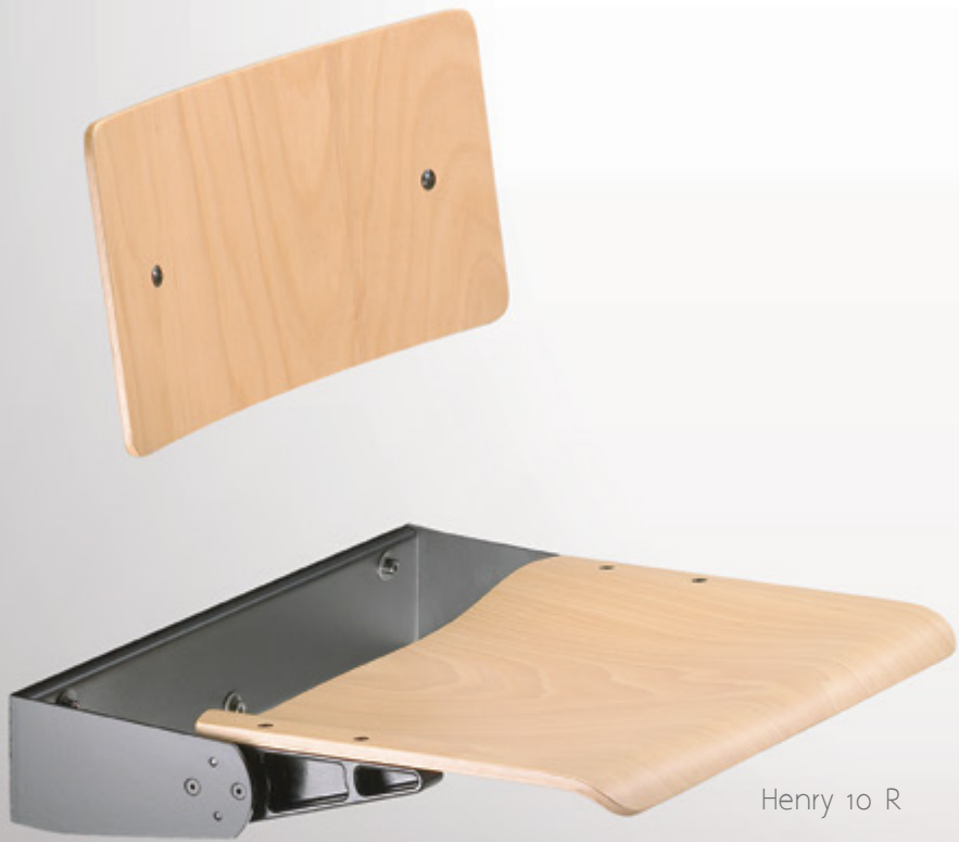
Henry 10 R