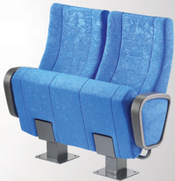
Oscar Love Seat